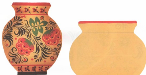
Рис 3. Пример задания на создание композиции