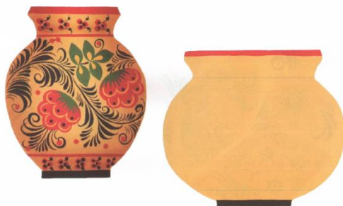
Рис 3. Пример задания на создание композиции