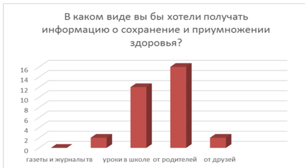
Рисунок 10 – Вопрос «В каком виде вы бы хотели получать информацию о сохранение и приумножении здоровья?»

В анкетирование участвовали 30 человек, «телевидение» ответил 1 человек, «уроки в школе» ответили 11 человек, «от родителей» ответили 16 человека, «от друзей» - 2 человека.