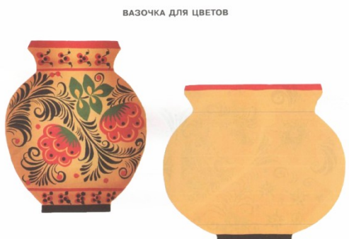
Рис 3. Пример задания на создание композиции