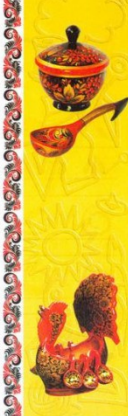
Рис 1. Информационная часть рабочих тетрадей по мезенской и хохломской росписям

3. Практическая часть. В этой части ученикам предлагаются задания для самостоятельной работы. Первая часть может состоять из упражнений на повторение (рис 2), вторая часть на создание целостной композиции из основных элементов (рис 3).