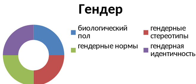
Рис. 1. Компоненты структуры гендера.

Понятие «гендер» обозначает базовую характеристику личности и обуславливает «биологическое, психологическое и социальное развитие человека [5].