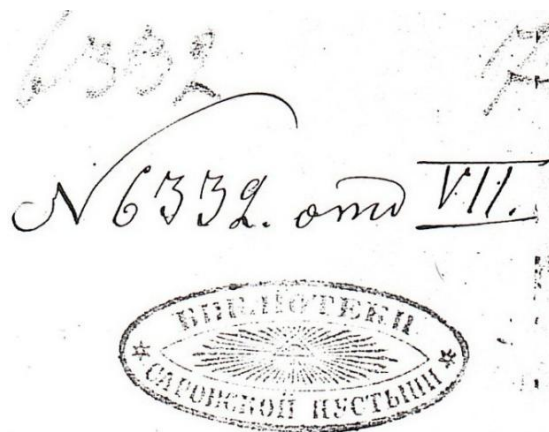
Илл. 3. Штамп мая 1891 года на книге саровского архива